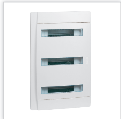
Practibox – rozdzielnicę wgnęwkową o szerokości 12 modułów z drzwiami półprzezroczystymi w komplecie. Stopień ochrony: IP40 – IK07 z drzwiami. Znamionowe napięcie pracy: 400 V AC – 50/60 Hz. Izolacyjność: II klasa ochronności.