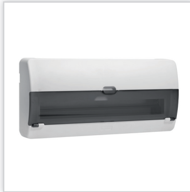
Nedbox RX – rozdzielnicę ścienną, jednorzędowe o 12, 16 lub 22 modułach z drzwiami przezroczystymi lub białymi. Stopień ochrony: IP30 – IK07 z drzwiami. Znamionowe napięcie pracy: 400 V AC – 50/60 Hz. Izolacyjność: II klasa ochronności.