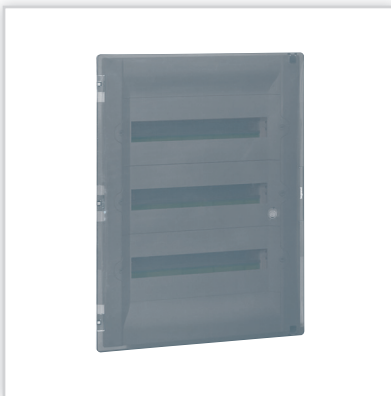
Practibox 3 – rozdzielnicę wgnęwkową o szerokości 18 modułów z drzwiami przezroczystymi (dymnymi) lub białymi w komplecie. Stopień ochrony: IP40 – IK09 z drzwiami. Znamionowe napięcie pracy: 400 V AC 50/60 Hz. Izolacyjność: II klasa ochronności.