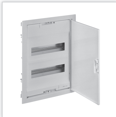
RWN – rozdzielnicę wgnęwkową o szerokości 12 modułów z drzwiami metalowymi w kolorze białym w komplecie. Stopień ochrony: IP40 – IK07 z drzwiami. Znamionowe napięcie pracy: 400 V AC – 50/60 Hz. Izolacyjność: II klasa ochronności.