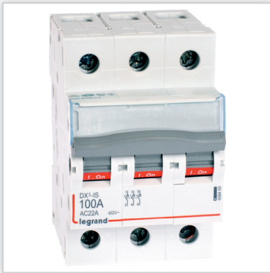
Rozłączniki izolacyjne FR 300 – rozwiązania jedno-, dwu-, trzy- i czterobiegunowe; prądy znamionowe od 16 do 125 A.