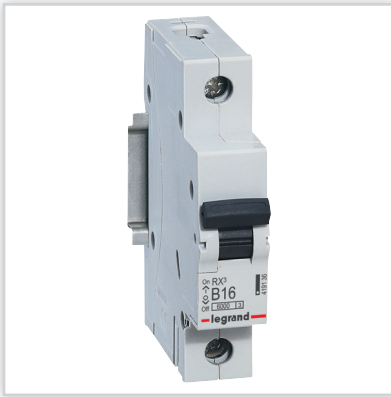
Wyłączniki nadprądowe RX 3 – rozwiązania jedno- i trójbiegunowe; zdolność zwarciova 6000 A (zgodnie z normą EN 60898-1); charakterystyki B i C; prądowy znamionowe 10, 16, 20 i 25 A.