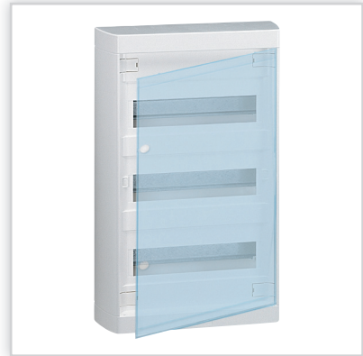
Nedbox – rozdzielnicę ścienną o szerokości 12 modułów z drzwiami przezroczystymi lub białymi w komplecie. Stopień ochrony: IP40 – IK07 z drzwiami. Znamionowe napięcie pracy: 400 V AC – 50/60 Hz. Izolacyjność: II klasa ochronności.