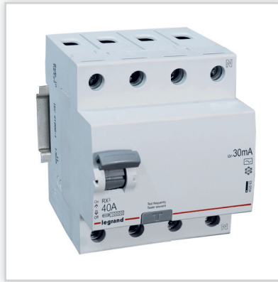
Wyłączniki różnicowoprądowe RX 3 – rozwiązania dwu- i czterobiegunowe; prądy znamionowe 25 i 40 A; znamionowy prąd różnicowy 30 mA; typ AC.